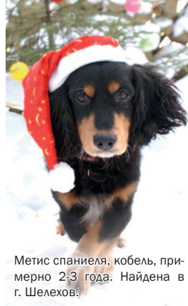
Метис спаниеля, кобель, примерно 2-3 года. Найдена в г. Шелехов.

Итак, приучите ребенка мыть руки, а вашего четвероногого друга – не грызть игрушки, не забираться на кровать. Позаботьтесь о том, чтобы собачья миска сразу после еды была убрана. Собаке должны быть сделаны необходимые прививки, у нее не должно быть блох. Каждые 3 месяца нужно глистогонить собаку (кстати, каждые 3 – 6 месяцев это необходимо и ребенку, т.к. он все тянет в рот и редко моет руки). Хорошо, если животное будет стерилизовано. Такая собака в почтенном возрасте ведет себя как молодая: ласково и нежно относится к детям, играет, заботится о них, охраняет. В 99 случаях из 100