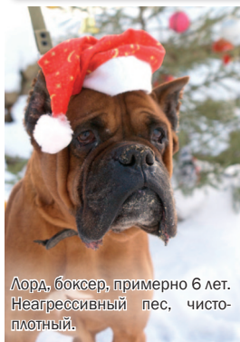
Лорд, боксер, примерно 6 лет. Неагрессивный пес, чистоплотный.

взрослая собака снисходительна и терпелива к детским выходкам. А потому, если ваш ребенок совсем маленький, то лучше не заводить щенка: в первый год жизни он требует не меньше внимания, чем ребенок. Но если вы твердо решили завести питомца, можно взять собаку из приюта. Работники помогут подобрать вам животное со спокойным, послушным характером, а также с учетом ваших домашних условий.