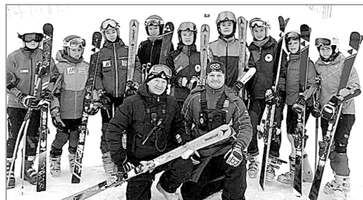
Команда Иркутской области

С успешного выступления на всероссийских соревнованиях начали год воспитанники горнолыжной школы «Олха».